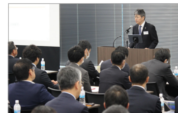
ユニ・チャーム中長期方針説明会

当社は、資材品質の安定化と、調達における方針やガイドライン浸透を目的として、2023年10月にサプライヤーを対象とした「第14回ユニ・チャーム中長期方針説明会」を開催しました。今回は、パーソナルケア商品向け資材サプライヤーに加え、ペットケア商品向け資材サプライヤーや外部生産委託先など、オンラインを含めて143社371名が参加しました。説明会では、第12次中期経営計画の概要やペットケア事業の生産・物流機能の分割と移管などについて説明するとともに、持続可能なサプライチェーン構築のための当社方針やガイドラインの理解とSedexの活用、「Kyo-sei Life Vision 2030」「環境目標2030」の達成に向けた「GHG排出量可視化プロジェクト」へのデータ提供、安心な商品の供給による顧客満足度向上の実現を目指す品質管理活動などについて協力を要請しました。