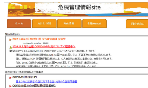
危機管理情報サイト

当社では2017年より、国内外に勤務する社員の人命に関わるリスクに特化した「危機管理情報サイト」をイントラネット上に立ち上げました。具体的には自然災害、パンデミック、労働災害、設備の大規模事故、誘拐、施設への侵入破壊行為、テロ、暴動・クーデター・内戦を対象とし、「ユニ・チャームグループ行動憲章」に記載しています。また、外務省や契約しているリスクマネジメント会社から発信される情報を日次でアップデートし、2018年には事象別に対応手順を明記した「海外危機管理マニュアル」を作成。2019年には「国内自然災害対応マニュアル」「本社特殊暴力対応マニュアル」を作成し、同サイトの各種マニュアルのページに追加。2020年にはCOVID-19のパンデミック発生を受け、現在も継続的に有効な出張制限情報や、トップページに新たな注意事項を掲示するなど、安全を取り巻く環境変化に対応し、情報の鮮度維持に努めています。